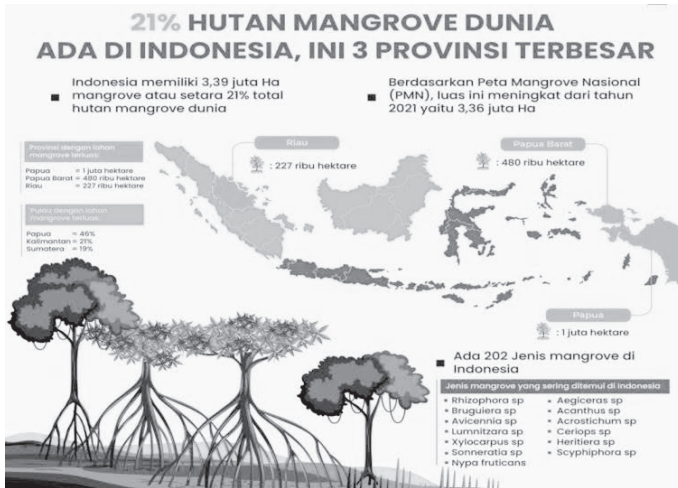
Gambar 1 | Data luas hutan mangrove

Mangrove memiliki banyak manfaat penting. Secara ekologis, mangrove berfungsi sebagai habitat bagi makhluk hidup laut, menahan erosi, dan menyerap karbon dioksida (Irwanto et al., 2024). Jika dikelola dengan baik, mangrove dapat memberikan manfaat ekonomi berkelanjutan bagi masyarakat melalui sektor perikanan, ekowisata, maupun pengembangan produk olahan. Hutan mangrove tidak hanya memberikan manfaat yang secara langsung dapat dirasakan, tetapi juga memiliki banyak manfaat yang sering kali kurang disadari oleh masyarakat yaitu sebagai pelindung alami wilayah pesisir. Dengan adanya mangrove, kerusakan garis pantai dapat diminimalkan tanpa harus menggunakan teknologi buatan yang mahal. Mangrove juga memiliki kemampuan yang tinggi dalam menyerap karbon